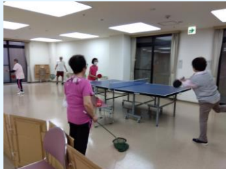
▲元気に活動中です!!

第2(木)・第4(水)14時～ 1～2 台の卓球台を使用し ています。ラケット等ご持 参いただき、動きやすい服 装でご参加ください。