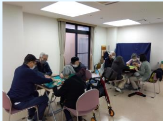
▲一番人気はマージャンです

第2・第4(金) 10時～ マージャン、囲碁、将棋、 オセロなどから選んで対戦 できます。初めてのゲーム にも出会えるかも!?