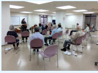
▲この日は太鼓を使った体操でした

毎週水曜日 10時30分～ 椅子に座ったままできる 体操を行っています。体操 後は皆さんで歌やおしゃ べりを楽しんでいます。